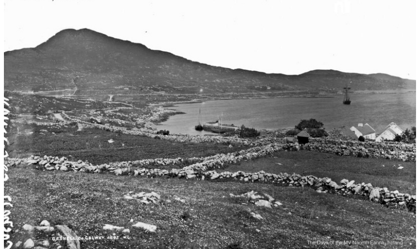
Cashel, Co. Galway, Ireland, circa 1890s.

Buíochas le The Days of the MV Naomh Éanna, Ireland as cead a thabhairt a gcuid pictiúr a úsáid.