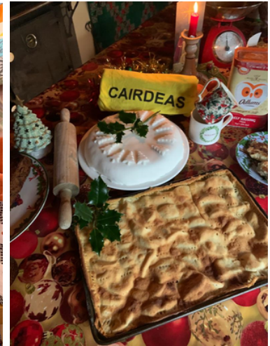
Milseoga do rannpháirtithe 'Béile ar Rothaí'