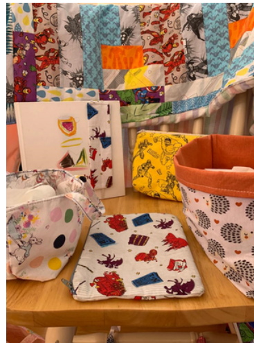
Cúrsaí Caitheamh Aimsire