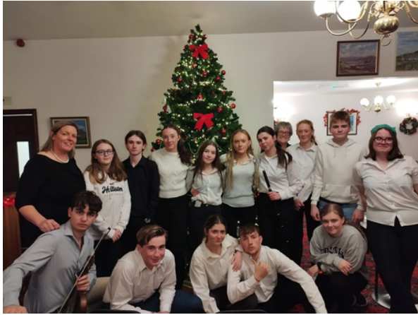
Daltaí na hIdirbhliana agus an fhoireann