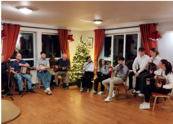
An grúpa ceoil