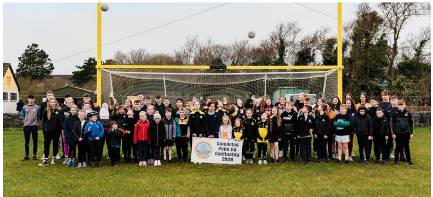
Óige an cheantair ag súil go mór le Comórtas Peile na Gaeltachta 2028!