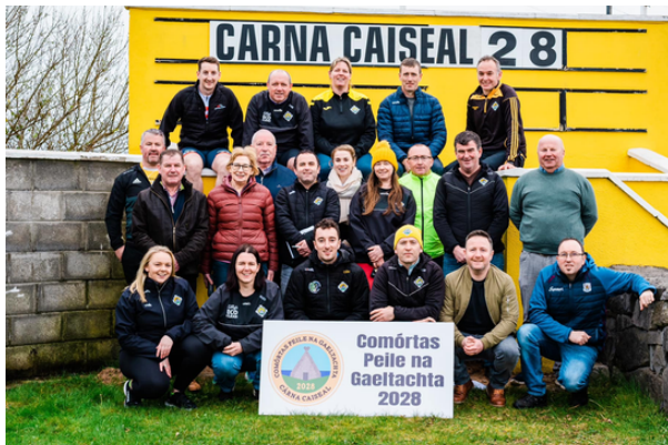
Baill den choiste tacaíochta nua don chomórtas

Tháinig slua bhreá amach chuig an ócáid ar Pháirc Charna ar an 25ú Márta nuair a fógraíodh go hoifigiúil go mbeidh Comórtas Peile na Gaeltachta dhá réachtáil i gCarna i 2028, tráth a bheas an cumann ag ceiliúradh 100 bliain a bhunaithe. Roinneadh eolas chomh maith faoi na háiseanna nua poiblí spóirt a bheas á thógáil. Ní fada uainn anois é agus táimid ag súil go mór leis.