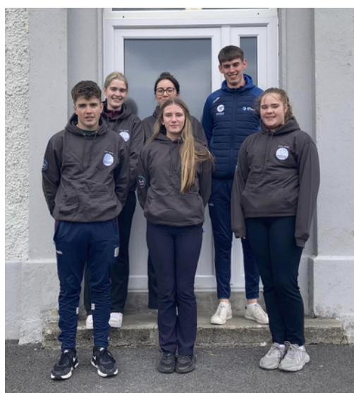
Coiste Gaeilge Choláiste na bPíarsach bródúil as a gceannasaithe a bhronn Pleanáil Teanga Chonamara Láir orthu.

Comhghairdeas ó chroí le Anseo Anois , togra de chuid Scoil Phobail Charna, a thug leo an Gradam Nuálaíochta ag babhta ceannais Chlár na gComhlachtaí a reáchtáladh in Óstán Chois Fharráige sna Forbacha ar an 20ú Aibreán. Is togra fíor-dhifriúil agus fíor-speisialta é- geansaí spóirt agus cód QR air ag léiriú tacaíochta agus treoir do dhaoine óga le deacrachtaí meabhairshláinte.