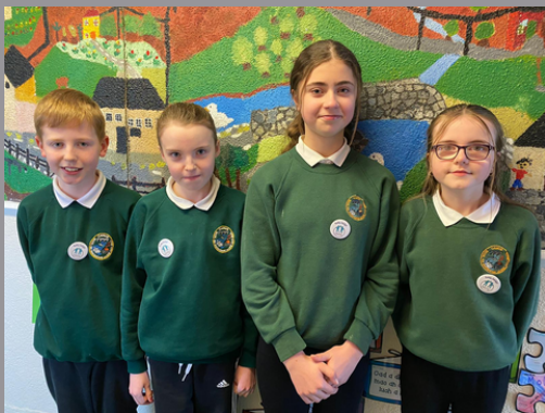
'Buddies Gaeilge' Scoil na Maighdine Muire Gan Smál, Camus, agus iad bródúil as a suaitheantais

Is scéim nua í seo a d'fhorbair Pleanáil Teanga Chonamara Láir i gcomhar leis na múinteoirí ranga. Go bunúsach, is éard atá i gceist léi ná go bhfuil na daltaí níos sine ag feidhmiú mar mheantóir/chúntóir Gaeilge a chabhraíonn leis na páistí eile. Is í aidhm na scéime ná spreagadh a thabhairt do na meantóirí Gaeilge a bheith muiníneach agus iad ag labhairt na teanga agus bród agus meas a chothú don Ghaeilge. Ina theannta sin, ní hamháin go gcabhróidh siad leis an múinteoir, foghlaimoidh siad trí thaithí, éireoidh siad