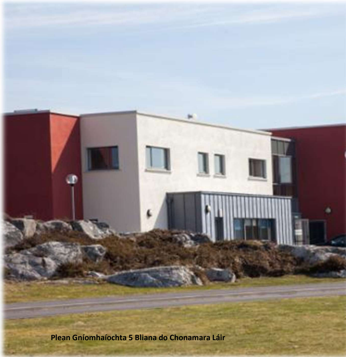
Plean Gnóimhaíochta 5 Bliana do Chonamara Láir