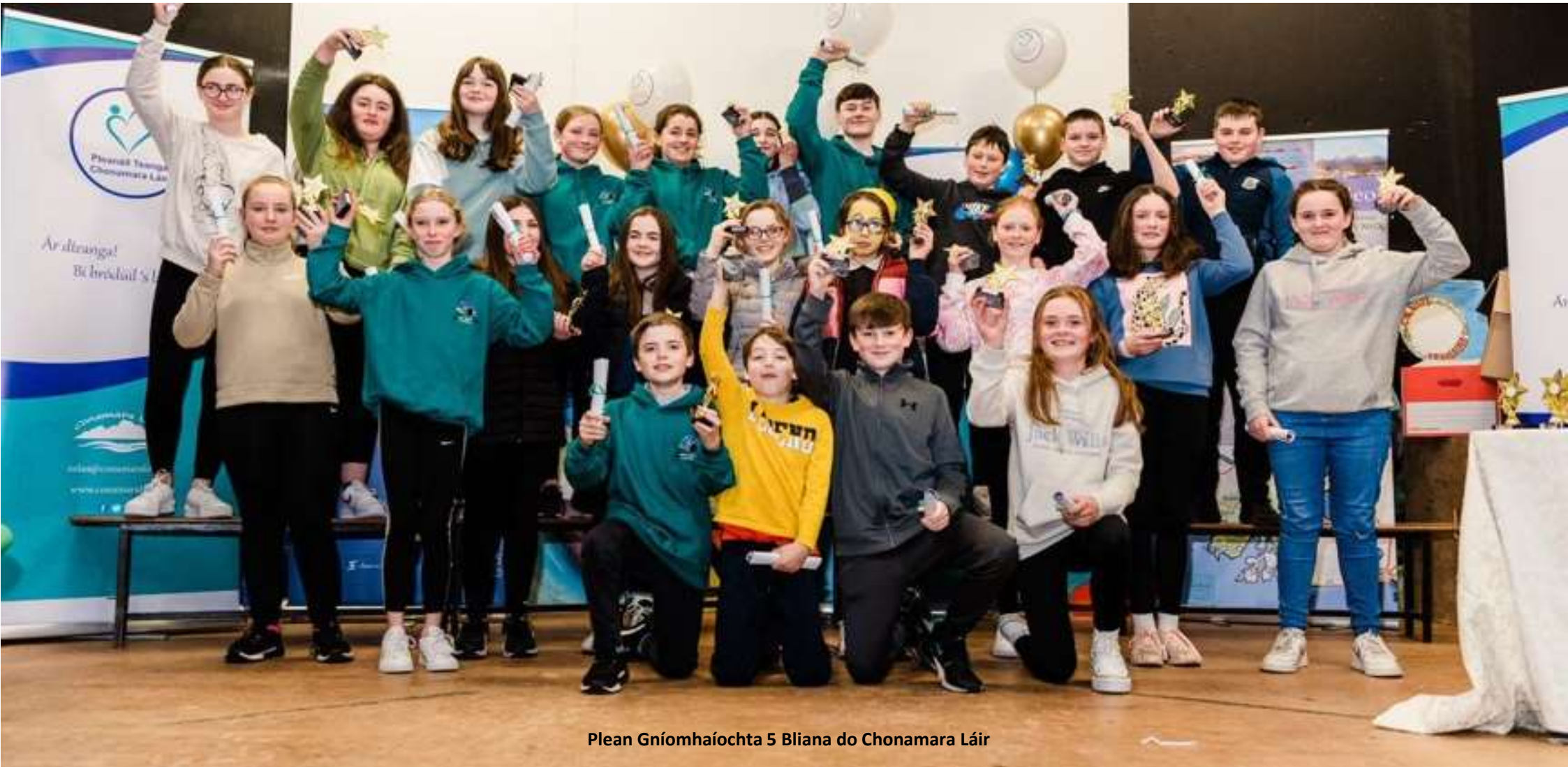
Plean Gníomhaíochta 5 Bliana do Chonamara Láir